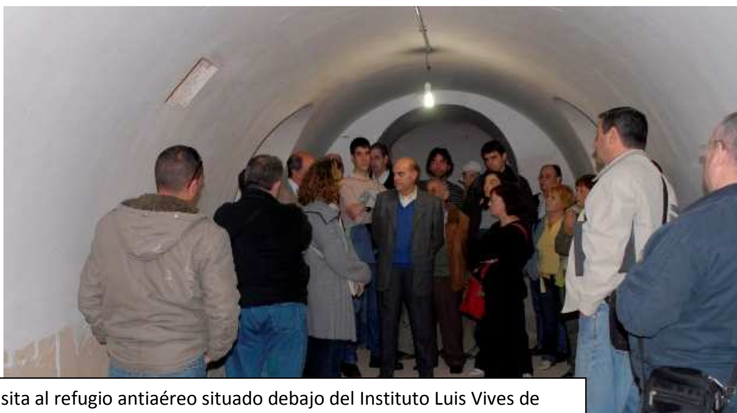
Una visita al refugio antiaéreo situado debajo del Instituto Luis Vives de Valencia.

Hemos querido incluir una pequeña información, obtenida a través de internet, sobre el refugio del Colegio Balmes pues si se rehabilitara, como el del Luis Vives, permitiría realizar ciertas actividades en un barrio muy precisado de espacios culturales y deportivos, y, a la vez, habría muchos vecinos y vecinas que desearían entrar ya que algún familiar se debió proteger en este refugio durante la Guerra Civil.